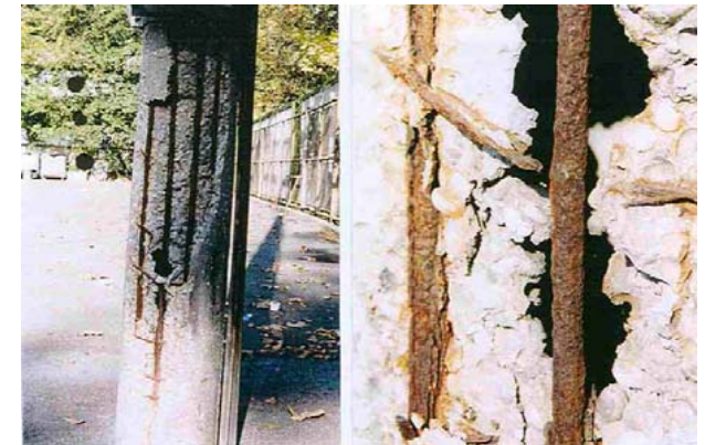
Korozija čelične armature betonskog rasvjetnog stupa