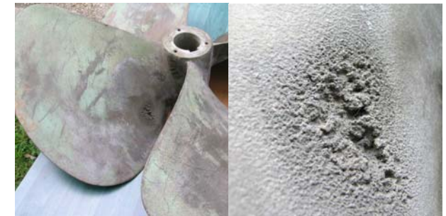
Kavitacijska korozija krila brodskog vijka

Studij je namijenjen inženjerima različitih struka koji se u svom radu susreću s problemom korozije i zaštite materijala.