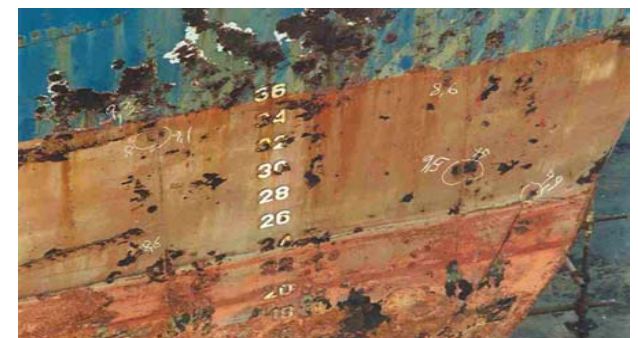
Razaranje zaštitne prevlake i korozija brodskog trupa